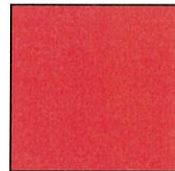
レッド Process:M80+Y100 DIC156