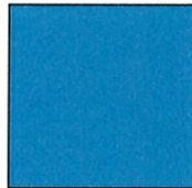
ブルー Process:C100+M20 DIC139